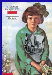
O mundo em que vivi