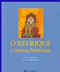
O Rei Rique e outras histórias