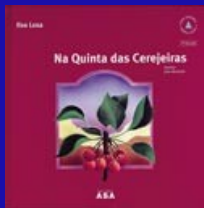
Na quinta das Cerejeiras