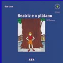
Beatriz e o plátano