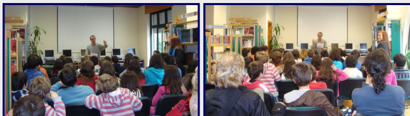
Sessão de poesia declamada pelo actor Armindo Cerqueira

Nos dias 19, 22 e 23 de Março a Biblioteca Escolar comemorou o dia da Poesia, da Árvore e da Água com uma exposição de trabalhos elaborados pelos alunos do pré-escolar, do 1º e 2º ciclo, uma sessão de poesia declamada pelo actor Armindo Cerqueira e com a leitura de poesias em sala de aula.