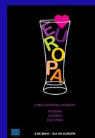
Dia da Europa