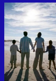
Dia da Família