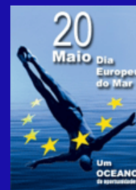
Dia Europeu do Mar